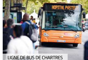
LIGNE DE BUS DE CHARTRES