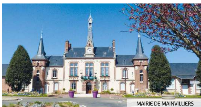
MAIRIE DE MAINVILLIERS