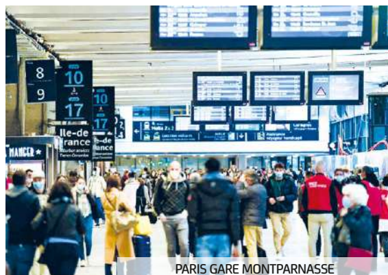
PARIS GARE MONTPARNASSE