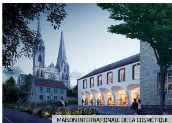
MAISON INTERNATIONALE DE LA COSMÉTIQUE